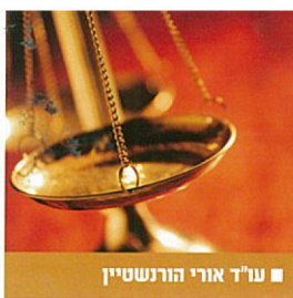
■ עו"ד אורי הורנשטיין